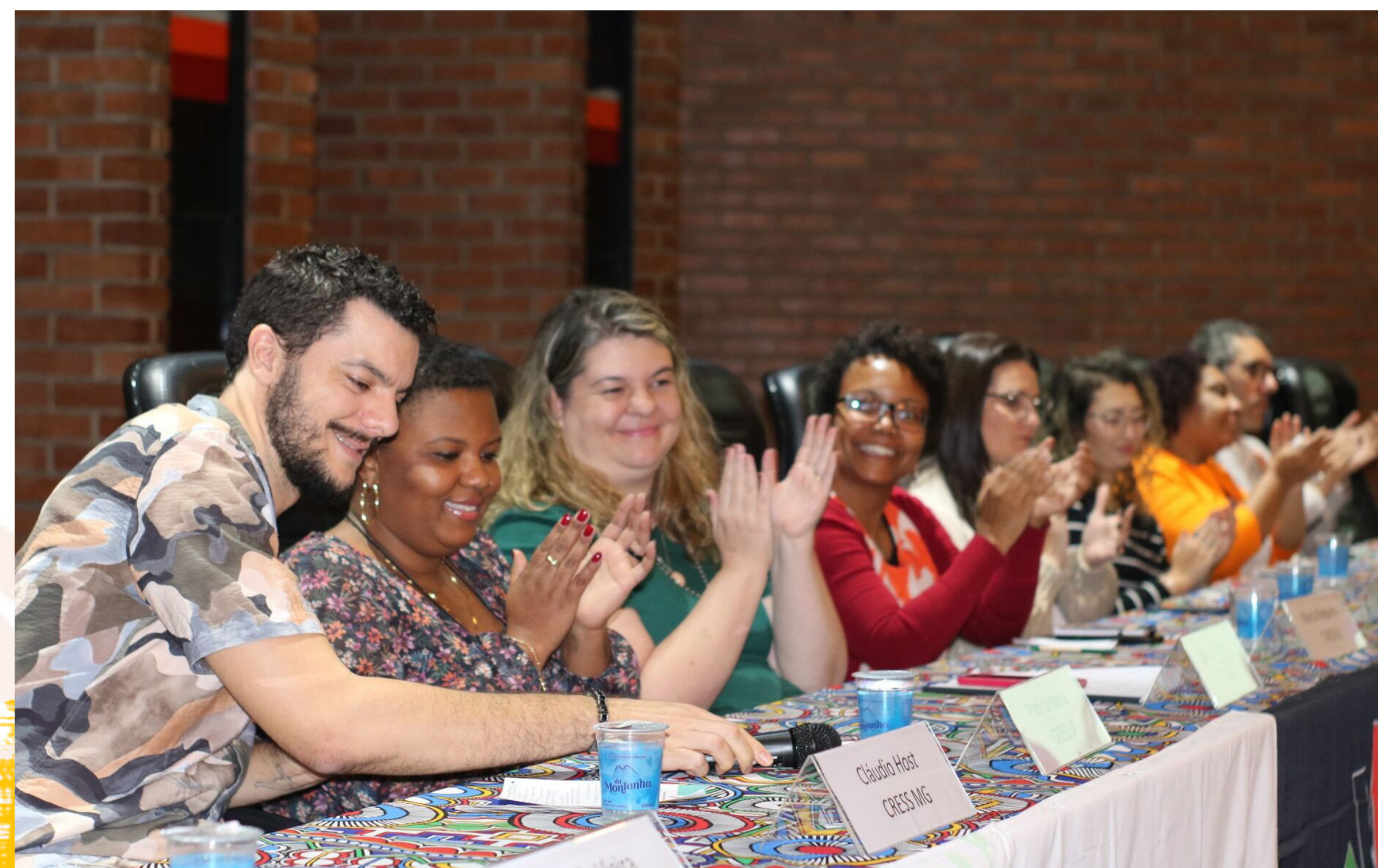
MESA DE ABERTURA 51º DESCENTRALIZADO DA REGIÃO SUDESTE - 24/07/24