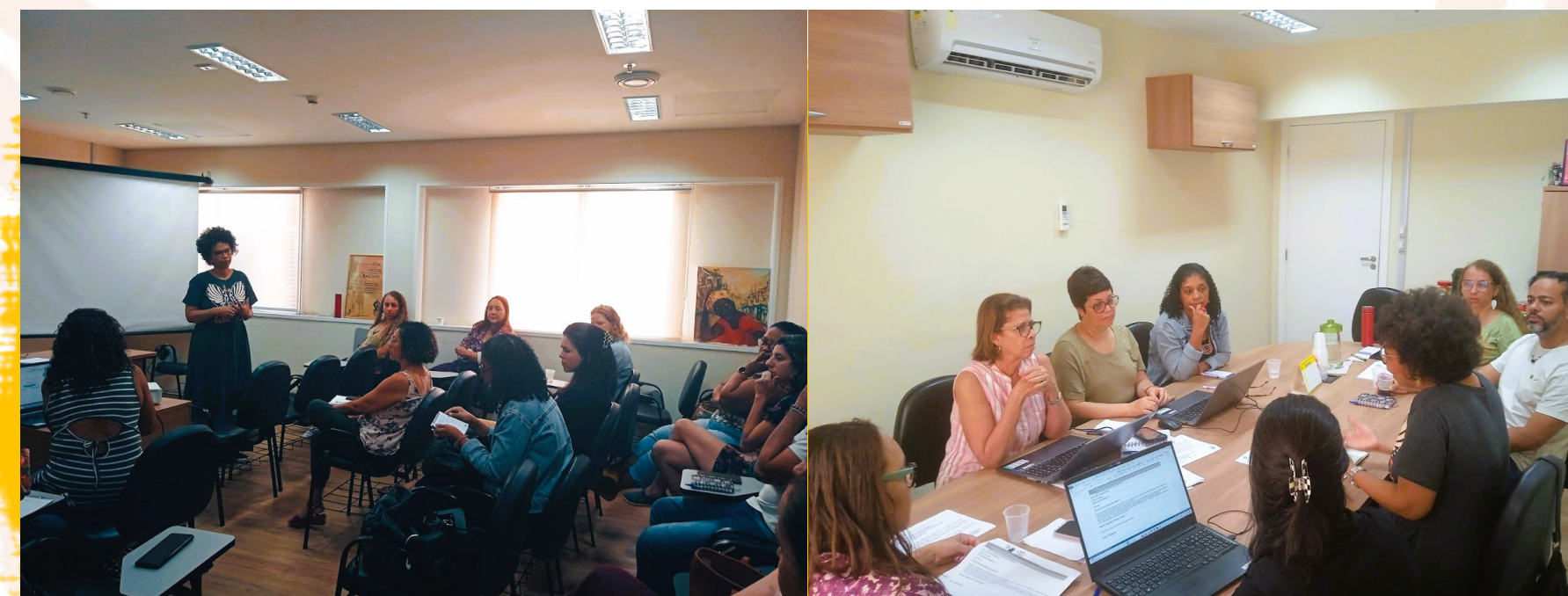
DIVIDIDOS EM SETE EIXOS - ADMINISTRATIVO-FINANCEIRO; ÉTICA E DIREITOS HUMANOS; COMUNICAÇÃO; FORMAÇÃO PROFISSIONAL E RELAÇÕES INTERNACIONAIS; SEGURIDADE SOCIAL; E ORIENTAÇÃO E FISCALIZAÇÃO - CRESS-RJ SE PREPARA PARA A ETAPA DO MONITORAMENTO DO 51º ENCONTRO NACIONAL.