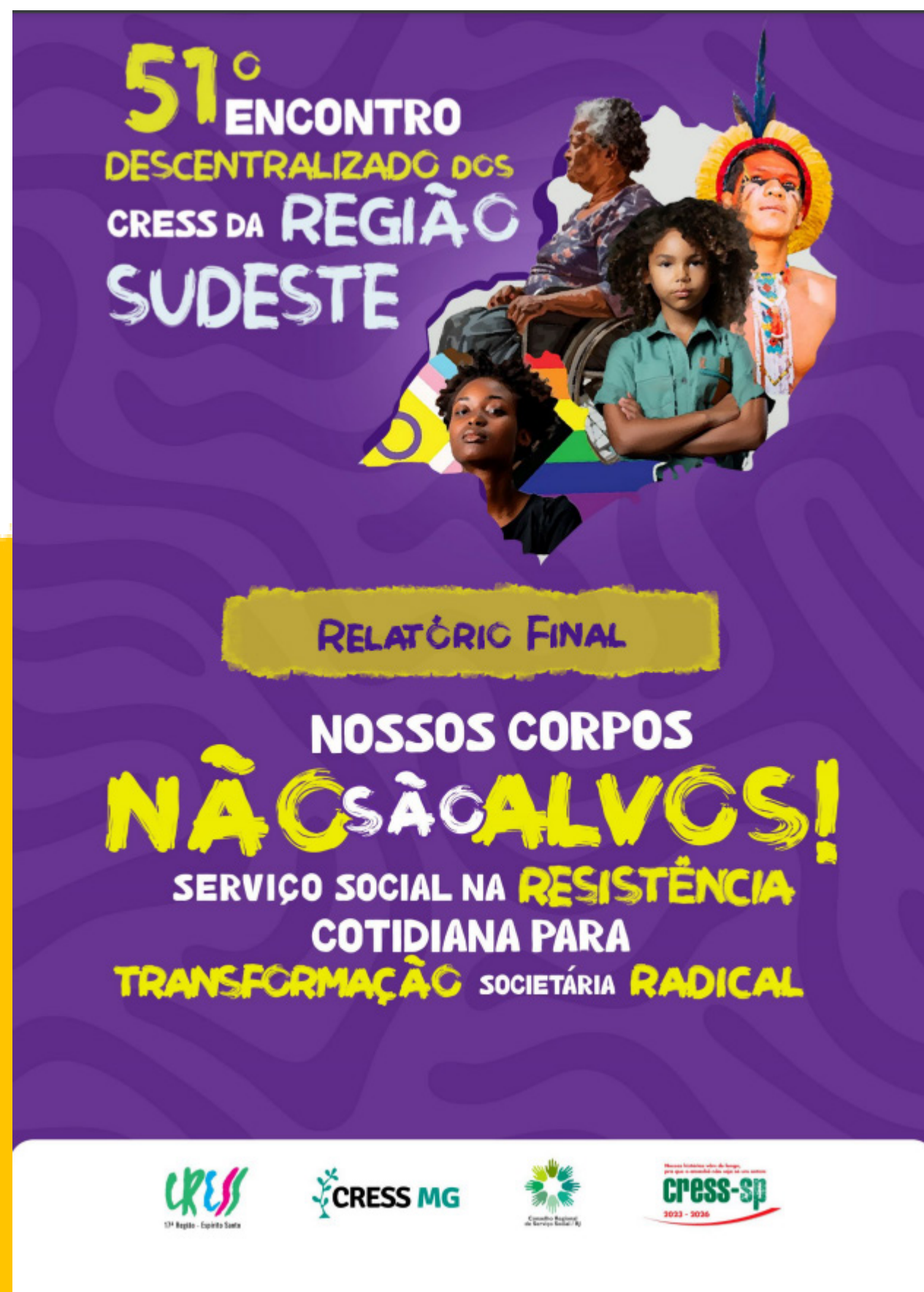
CAPA DO RELATÓRIO DO 51º ENCONTRO DESCENTRALIZADO.