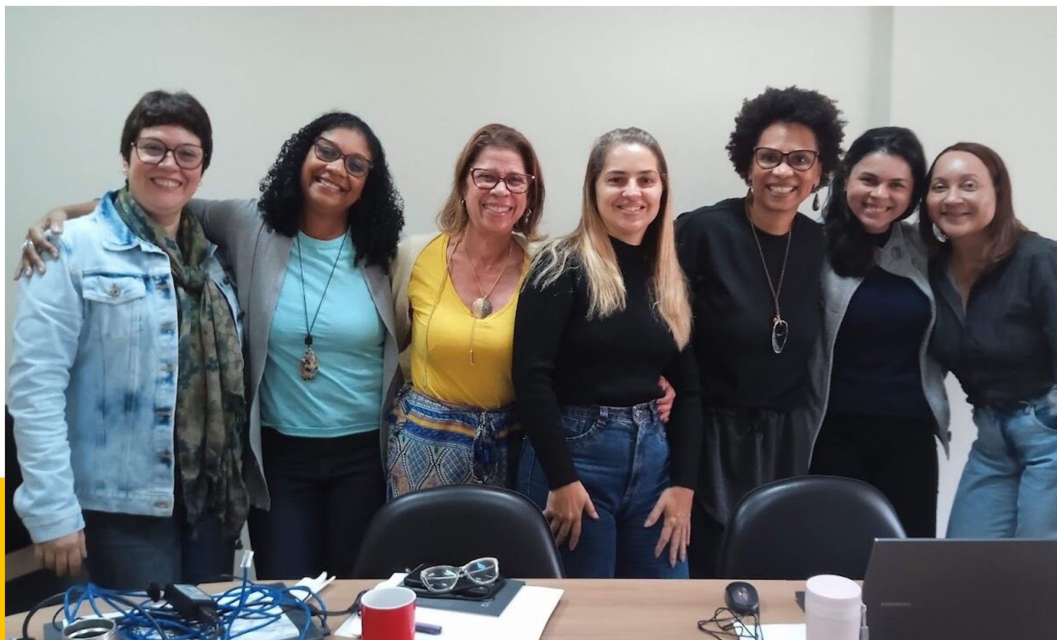
PREPARATÓRIO 51º DESCENTRALIZADO DA REGIÃO SUDESTE, EIXO ADMINISTRATIVO FINANCEIRO - 13/07/24

O 51º Encontro Descentralizado dos Conselhos Regionais de Serviço Social da Região Sudeste foi realizado, no ano de 2024, na Universidade Estadual do Rio de Janeiro/UERJ, entre os dias 24, 25 e 26 de julho, com o tema: “Nossos corpos não são alvos! Serviço Social na Resistência cotidiana para transformação societária radical”. Participaram do Encontro 125 pessoas, entre representantes dos CRESS da Região Sudeste, representantes do CFESS, convidados e a Comissão Organizadora do CRESS-RJ.