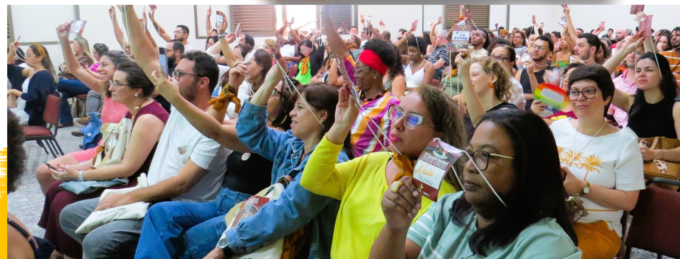
VOTAÇÃO 51º ENCONTRO NACIONAL DO CONJUNTO CFESS-CRESS - 05 A 08/09/24

Considerando a metodologia trienal do Conjunto CFESS-CRESS, neste ano foi realizada a segunda etapa, que compreende o monitoramento das deliberações do triênio 2023-2026. O encerramento do Descentralizado ocorreu em meio à mobilização de estudantes da UERJ que insistem em garantir seus direitos estudantis, após supressão de 1300 bolsas a partir de mudança de critérios e redução significativa de orçamento para estudantes em vulnerabilidade social na Universidade. Representados em sua maioria por negros, indígenas, LGBTI+, pessoas com deficiência e periféricos, esses estudantes têm total apoio do CRESS-RJ, que foi convidado pela Faculdade de Serviço Social da UERJ a realizar aula aberta sobre o caráter ético, político e formativo que o Estágio Supervisionado em Serviço Social requer, mesmo em momentos desafiadores como este de greve estudantil.