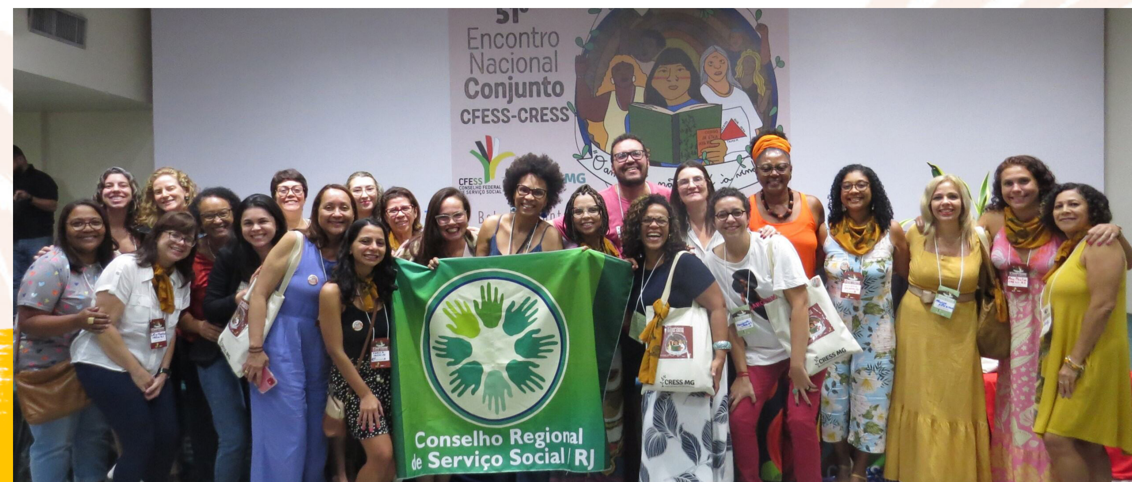
DELEGAÇÃO RIO NO 51º ENCONTRO NACIONAL DO CONJUNTO CFESS-CRESS - 05 A 08/09/24